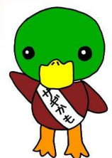
青森県警察特殊詐欺被害防止キャラクター「サギかむくん」