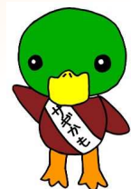
青森県警察特殊詐欺被害防止キャラクター「サギガもくん」