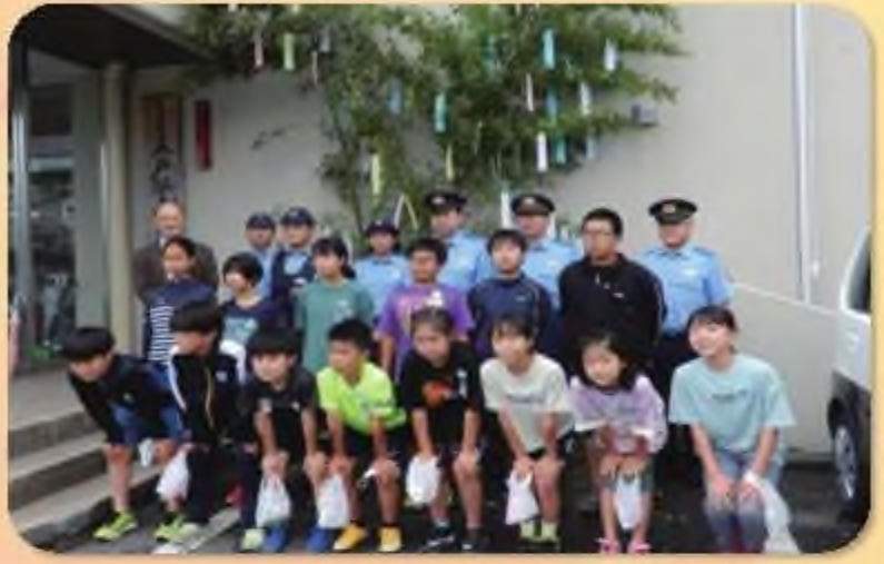
五戸町立五戸小学校リトルJUMPチーム