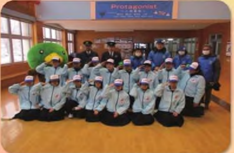
三沢市立第二中学校JUMPチーム