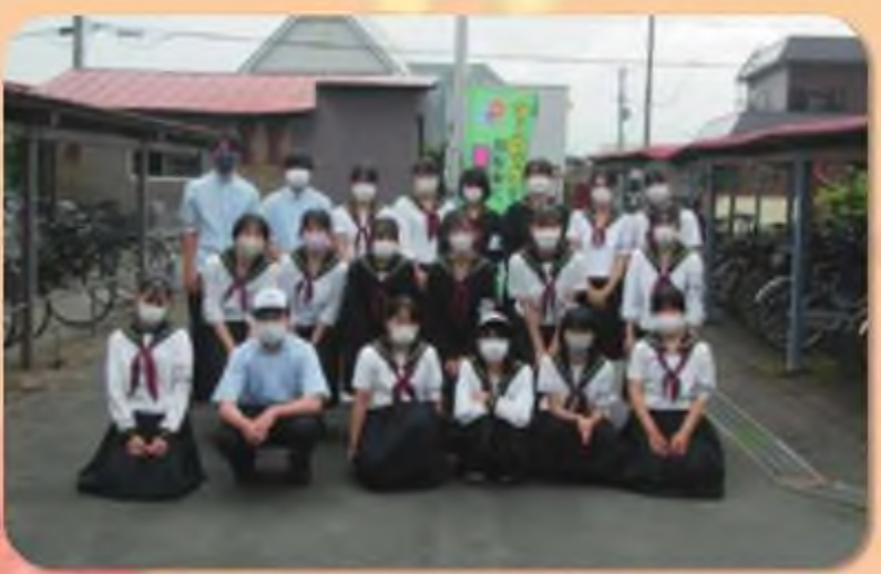
弘前学院聖愛中学高等学校JUMPチーム